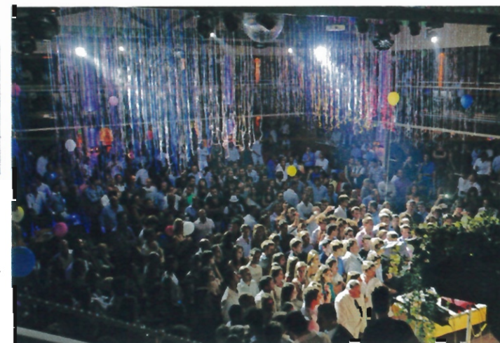
MARTINA STELLA. A DESTRA: DANIELA SANTANCHÉ E UN SABATO SERA ALLA CAPANNINA. A SINISTRA: IL TWIGA DI FLAVIO BRIATORE

conta si riconosce dalle camicie color pastello in lino portate rigorosamente fuori dai pantaloni, nella ressa si mischiano starlet tv e turisti stranieri pronti a intonare in un incerto italiano le melodie dei cantautori famosi in tutto il mondo.