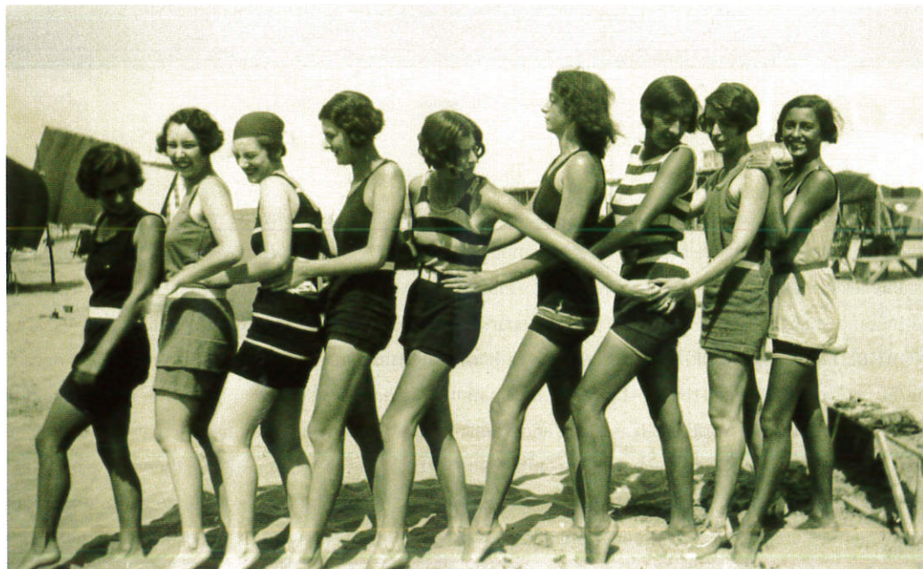
in basso: foto d'epoca, ragazze in spiaggia