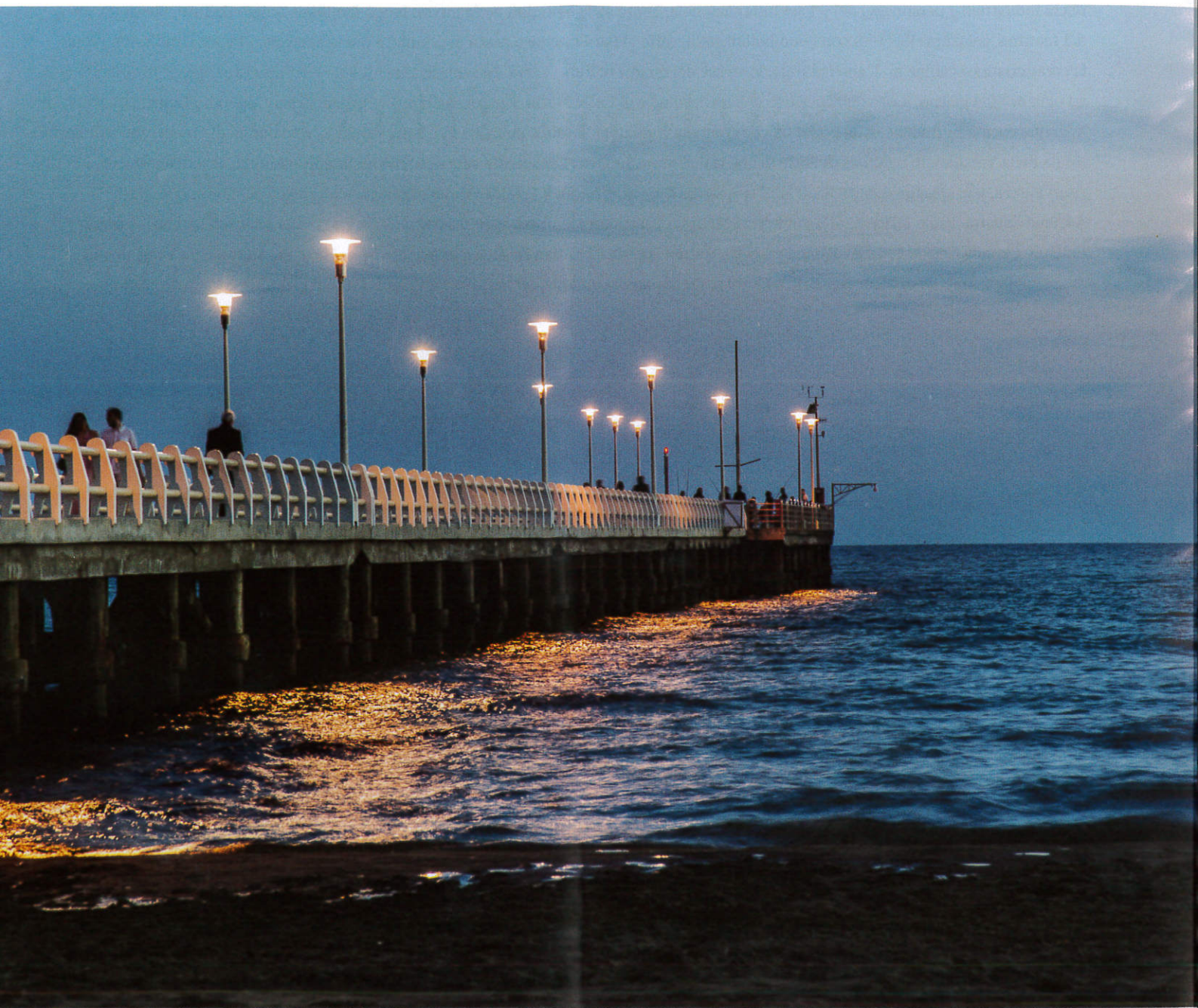
Nella foto: il pontile di Forte dei Marmi