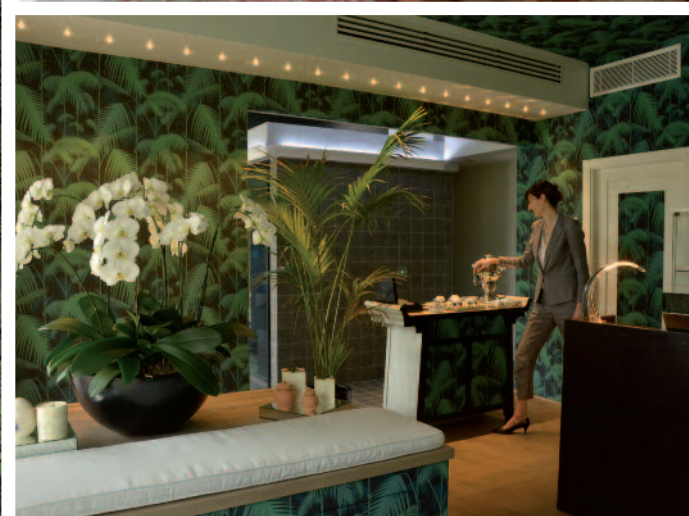
Anche quest'anno l'Augustus Hotel & Resort, a Forte dei Marmi, in Versilia, è tappa di circuiti per appassionati di auto come Terre di Canossa, dal 14 al 17 aprile, il Modena 100 Ore dal 7 al 12 giugno