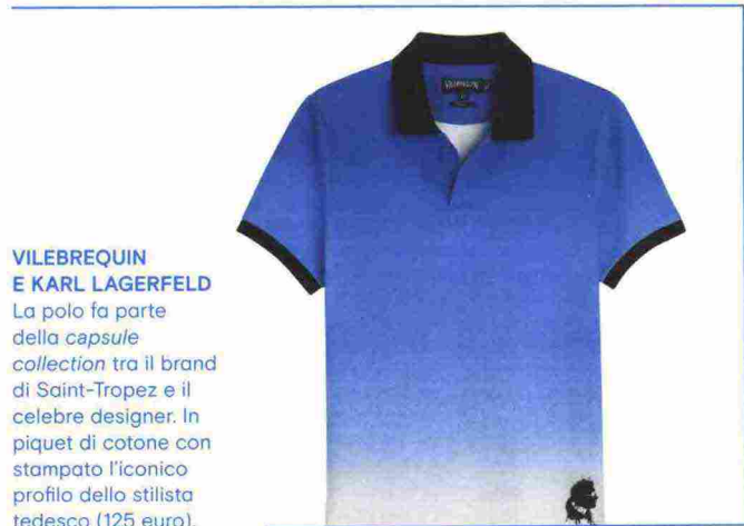
VILEBREQUIN E KARL LAGERFELD La polo fa parte della capsule collection tra il brand di Saint-Tropez e il celebre designer. In piquet di cotone con stampato l'iconico profilo dello stilista tedesco (125 euro).