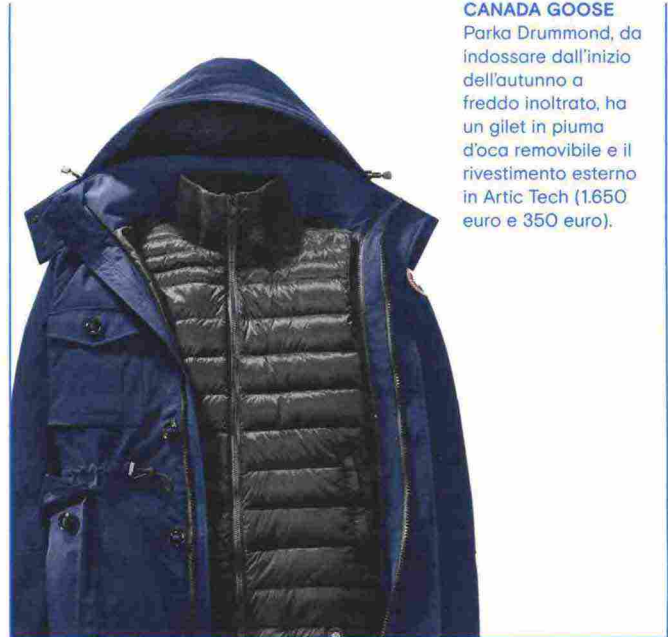
CANADA GOOSE Parka Drummond, da indossare dall'inizio dell'autunno a freddo inoltrato, ha un gilet in piuma d'oca removibile e il rivestimento esterno in Artic Tech (1.650 euro e 350 euro).