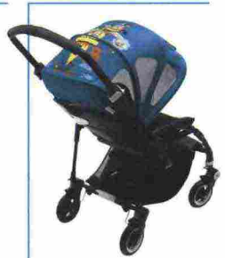
BUGABOO BY NIARK1 L'arte deve essere per tutti, e l'ultima collaborazione dell'azienda olandese è con lo street artist francese Niark1 per l'edizione limitata Monsters on the Move : colorate figure totemiche, su skate o pattini, emergono irriverenti su rivestimenti e cappottine dei passeggini Bugaboo, disponibili come accessorio (da 109,95 euro).