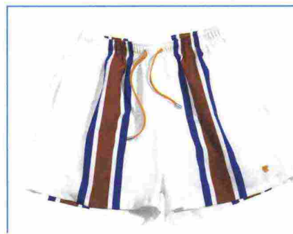
GALLO X AUGUSTUS Limited edition per i boxer da mare di Gallo creati con il famoso Augustus Hotel di Forte dei Marmi. In vendita in esclusiva nella boutique del brand e presso l'hotel, solo a Forte dei Marmi (99,50 euro).