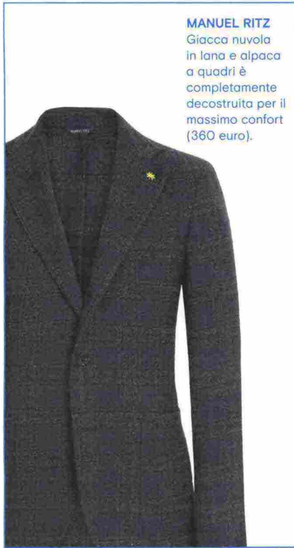
MANUEL RITZ Giacca nuvola in lana e alpaca a quadri è completamente decostruita per il massimo confort (360 euro).