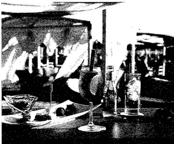
Un cocktail sulla spiaggia del Bambaissa

cole. Crudi di pesce, sushi, ostriche e creatività di mare e di terra dello chef caratterizzano il buffet di