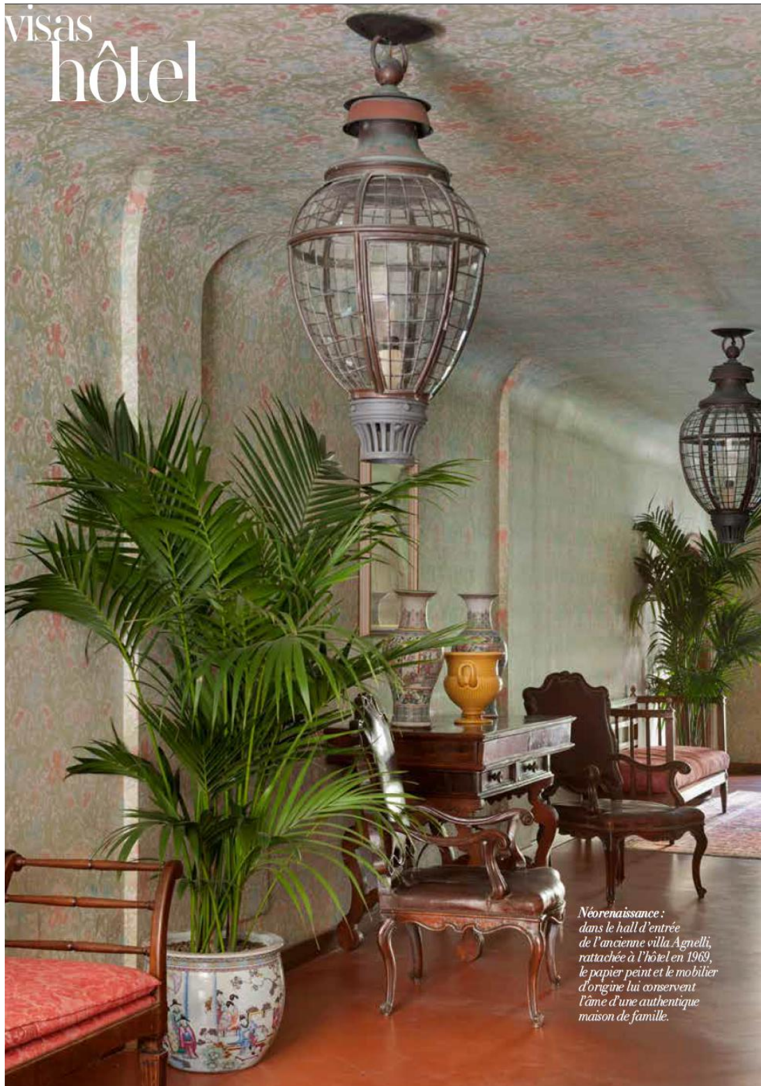
Néorenaissance : dans le hall d'entrée de l'ancienne villa Agnelli, rattachée à l'hôtel en 1969, le papier peint et le mobilier d'origine lui conservent l'âme d'une authentique maison de famille.