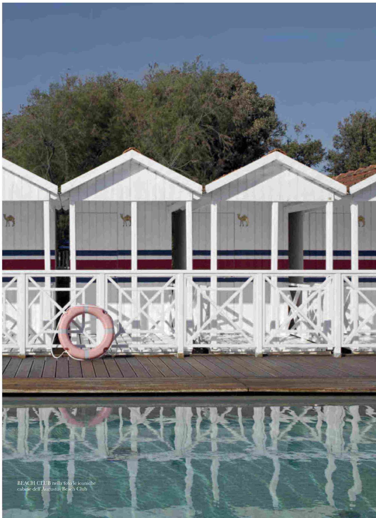
BEACH CLUB nella foto le iconiche cabine dell'Augustus Beach Club